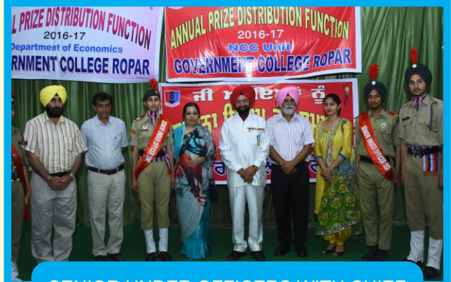
SENIOR UNDER OFFICERS WITH CHIEF GUESTS