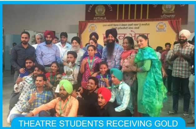
THEATRE STUDENTS RECEIVING GOLD MEDAL IN ONE ACT PLAY AT PUNJABI UNIVERSITY PATIALA