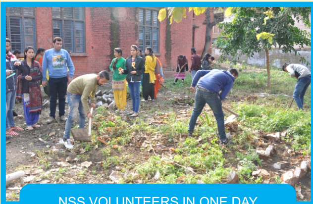
NSS VOLUNTEERS IN ONE DAY SHRAMDAN CAMP