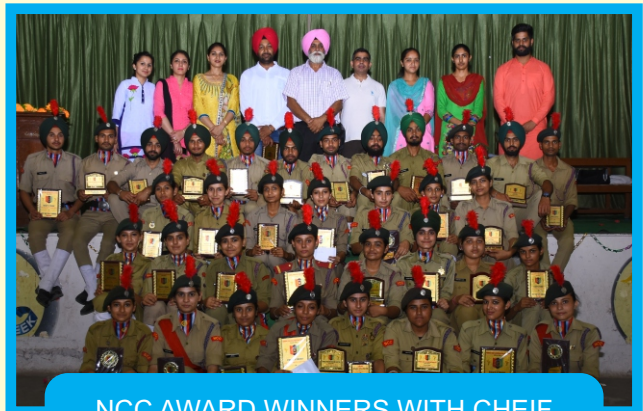
NCC AWARD WINNERS WITH CHIEF GUESTS AT ANNUAL PRIZE DISTRIBUTION