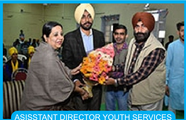
ASISSTANT DIRECTOR YOUTH SERVICES BEING WELCOMED BY PRINCIPAL AND STAFF