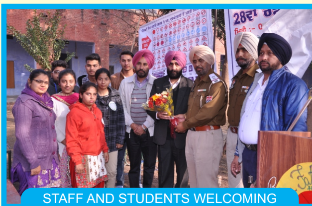
STAFF AND STUDENTS WELCOMING POLICE OFFICIALS ON ROAD SAFETY SEMINAR