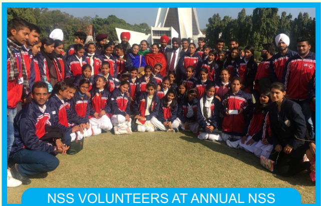
NSS VOLUNTEERS AT ANNUAL NSS CONVOCATION AT PUNJABI UNIV ,PATIALA