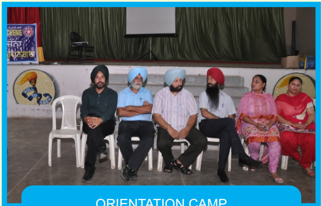
ORIENTATION CAMP OF NSS 2016