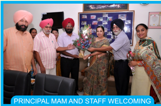
PRINCIPAL MAM AND STAFF WELCOMING CHIEF GUEST AT STATE LEVEL SLOGAN WRITING COMPETITION