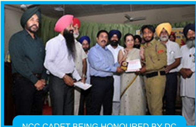
NCC CADET BEING HONOURED BY DC RUPNAGAR AT BLOOD DONATION CAMP