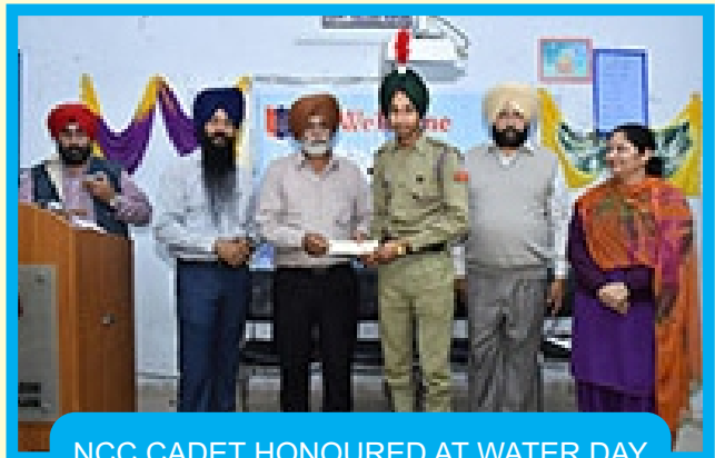
NCC CADET HONOURED AT WATER DAY CELEBRATIONS