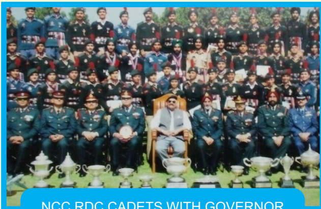
NCC RDC CADETS WITH GOVERNOR OF PUNJAB