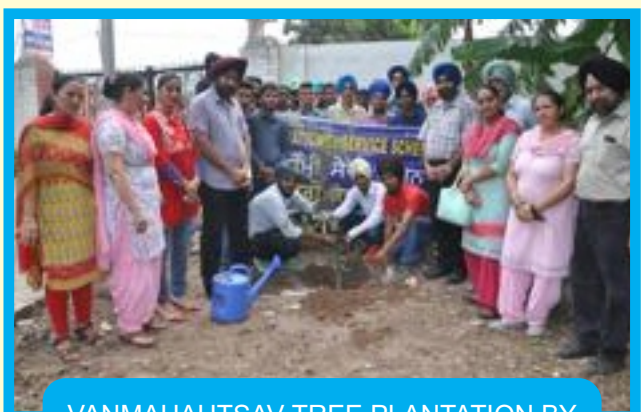
VANMAHAUTSAV-TREE PLANTATION BY NSS VOLUNTEERS AND NSS PO'S