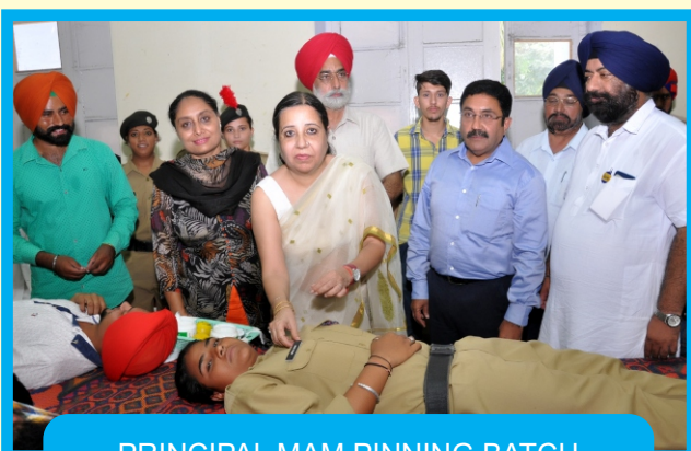
PRINCIPAL MAM PINNING BATCH TO A GIRL BLOOD DONOR