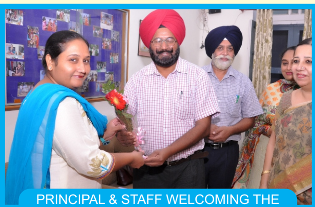
PRINCIPAL & STAFF WELCOMING THE JUDGE OF SLOGAN WRITING COMPETITION