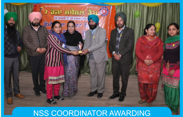
NSS COORDINATOR AWARDING VOLUNTEER ON CLOSING OF 7 DAY NSS CAMP