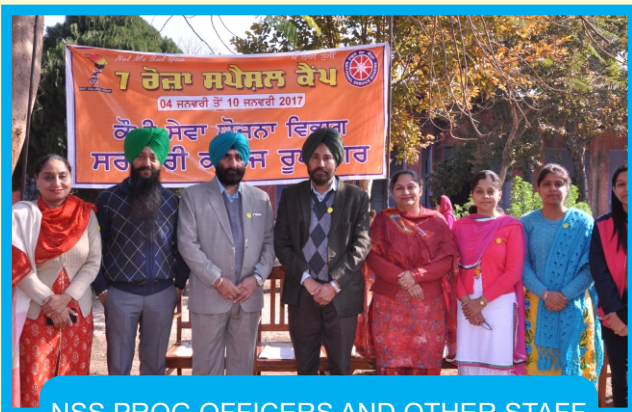
NSS PROG.OFFICERS AND OTHER STAFF AT 7 DAY SPECIAL NSS CAMP